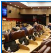
Фото с официального сайта Законодательного Собрания Иркутской области